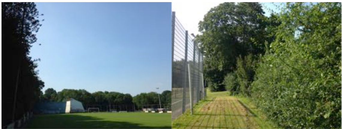
Afbeelding 3 Impressies van het plangebied