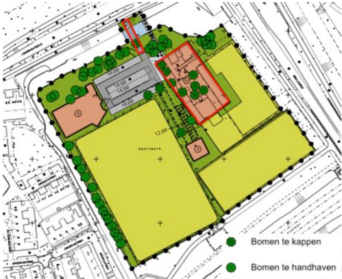
Afbeelding 2 Ligging van het plangebied met geplande nieuwe brug en sporthal (rood) en te kappen bomen (ondergrond: CAD-unit, REO Stedenbouw en Planologie)