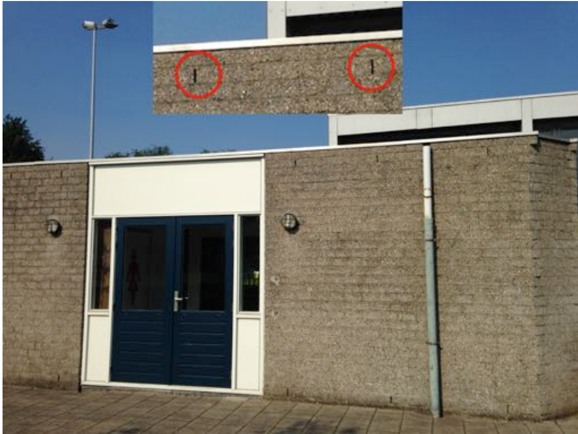
Afbeelding 4 De open stootvoegen in de opstallen. Deze wijzen op in potentie geschikte verblijfplaatsen van vleermuizen.